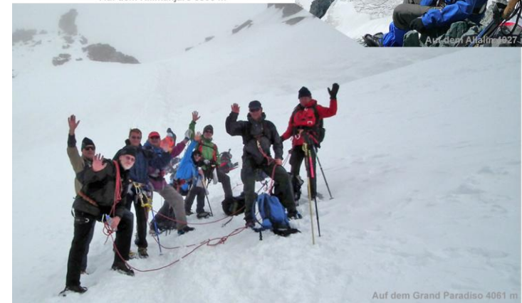
Auf dem Grand Paradiso 4061 m