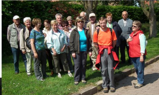
Frühlingstour am 30.04.2011 nach Hamma