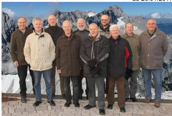
Neuer Vorstand ab 25.01.2011