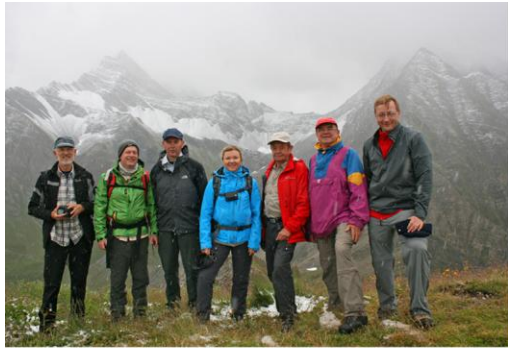
Am 20.07.2011 im Aostatal