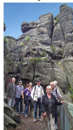
Auf Nonne 22.06.2011