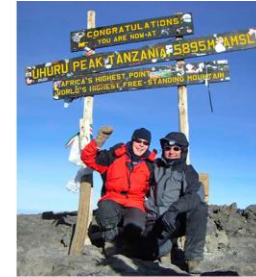
Auf dem Kilimanjaro 5895 m