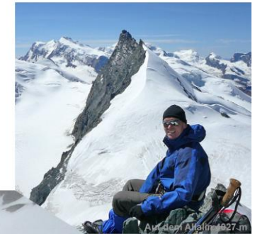
Auf dem A Matter 4927 m