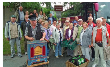
Zittauer Gebirge 21.06.2011